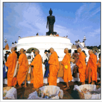
- ทำบุญตักบาตร บริเวณพุทธมณฑล -